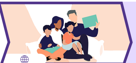
Site : FamiNum

Maintenant que vous avez discuté en famille, et si vous définissiez ensemble les bonnes pratiques numériques à adopter à la maison ? On a l'outil qu'il vous faut !