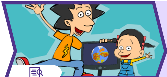
Guide : Internet, les écrans... et nous !

Vous pouvez maintenant approfondir le sujet avec ce guide pour réfléchir ensemble aux usages des jeux vidéo.