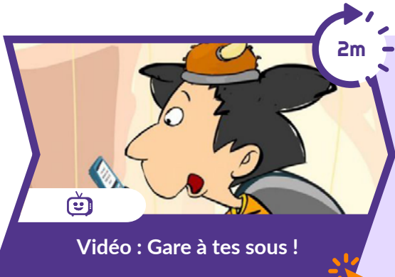
Vidéo : Gare à tes sous !

Pour commencer, cette vidéo permet de discuter en famille des risques des jeux vidéo.